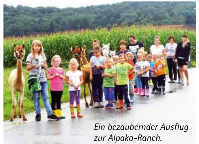
Ein bezaubernder Ausflug zur Alpaka-Ranch.